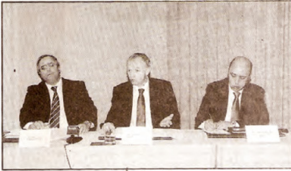
بعض مهتبي النقل خلال الندوة

مما يفتح فرصة حقيقية للمغرب للنمو في مجال الإبداع واللوغستيك. ويواجه مهتبي النقل، اليوم، العديد من الإشغالات من بينها السلامة الطرقية ومدونة السير الجديدة والتأثير على البيئة وارتفاع أسعار المحروقات والقوانين والإنتاجية... مما يفرض إجراء عصنة للتجهيزات والعربات، بالإضافة إلى اللجوء إلى جديد التكنولوجيات، التي تثبت كل يوم فعاليتها. لذا، أتى معرض «سوليترانس المتوسط» ليستجيب لهذه المتطلبات عبر جمع جميع فاعلي القطاع في معرض واحد.