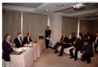
Salon du transport routier "SOLUTRANS Méditerranée", en juin prochain à Casablanca

http://www.entreprendre.ma/Salon-du-transport-routier-SOLUTRANS-Mediterranee--en-juin-prochain-a-Casablanca_a4232.html